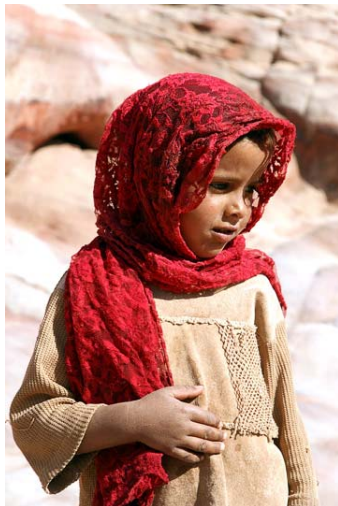
ילדה בדואית מאת-טוגהרה

ביום השלישי ירדנו שוב לפטרה דרך ערוץ ואדי מואייסרה המערבי, שמתחבר למדרגות המטפסות לא-דיר בואדי קהארובה. טיפסנו כמה מדרגות כדי להתרשם מארמון קבר האריות, וירדנו חזרה למרכז פטרה.