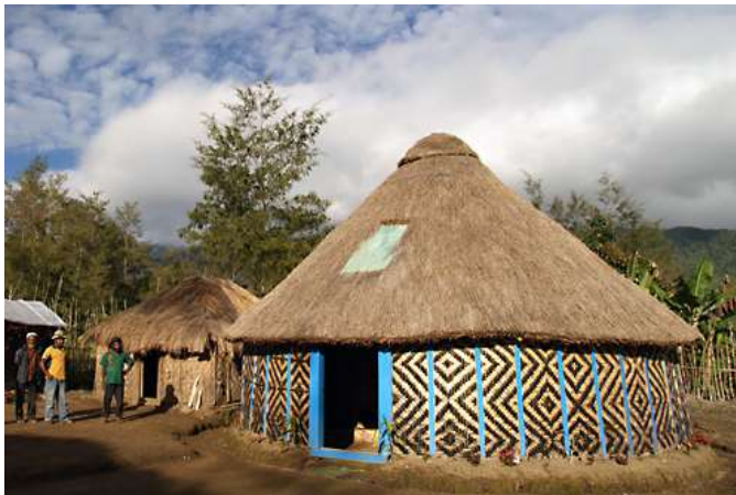
בקתת הקונאי שבה התארחתי בפולגה

כשהתכתבתי עם ורוניקה כדי להזמין אירוח בבקתה בטארי, היא שאלה אותי אם יש לי היכן להתאכסן במאונט האגן. היא כתבה שבעלה, יעקב, נמצא שם, שהם אוהבים חברים, והציעה לי בנדיבות רבה להתארח בבקתת