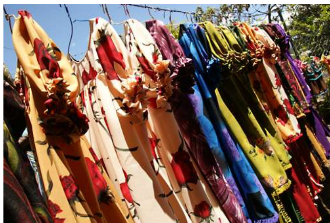
Meri Blouse בשוק

מקומית הנקראת: Meri Blouse (בשפה המקומית פירושו אישה), או פריט לבוש מקומי אחר. הנשים המקומיות מעריכות את המחווה, וגברים רואים בזה סימן לכך שמכבדים את התרבות והמנהגים המקומיים. החלטתי ללכת ביום הראשון לשוק, לרכוש חולצה כזו, וללבוש אותה בעת שהותי בפפואה. כך גם אקטין את הסכנה וגם אגרום הנאה למקומיים.